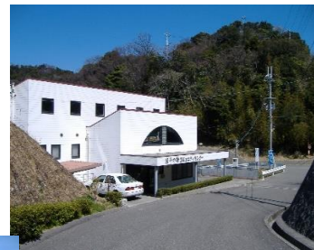
管理事務所 卓球場・シャワー室