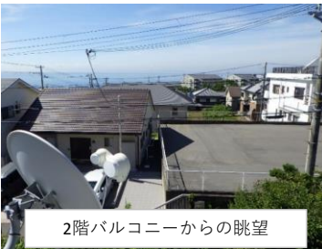
2階バルコニーからの眺望