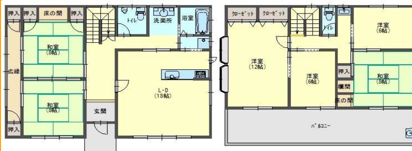
※現況と異なる場合は現況有姿