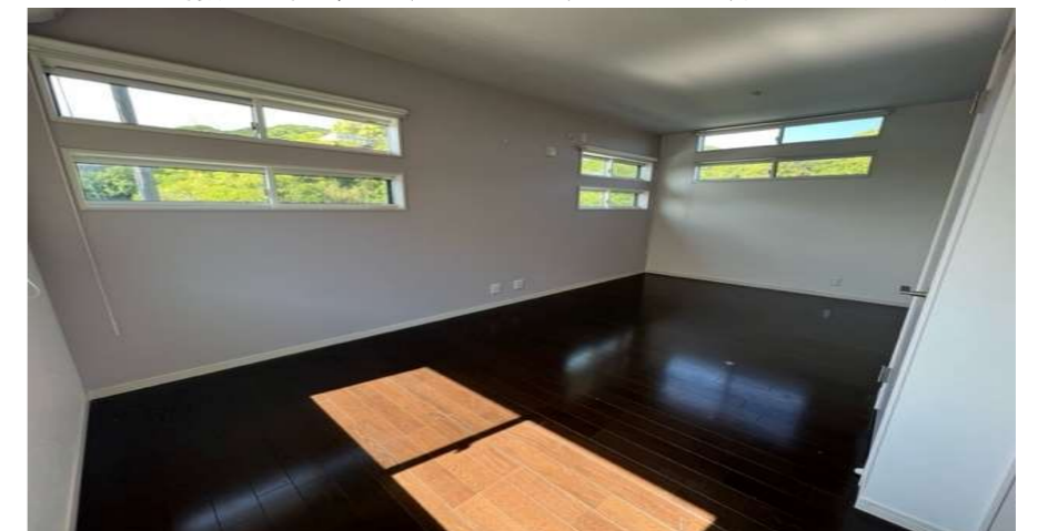
2階洋室(5.2/4.7)は2部屋に分割可能な設計になっています。