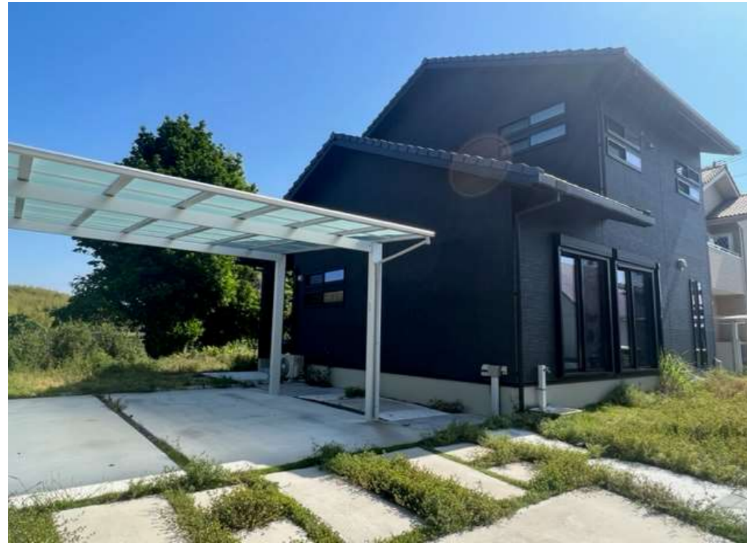
カーポートに2台+3台 余裕の駐車スペースがあります。