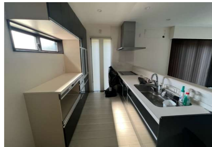
カウンターキッチン