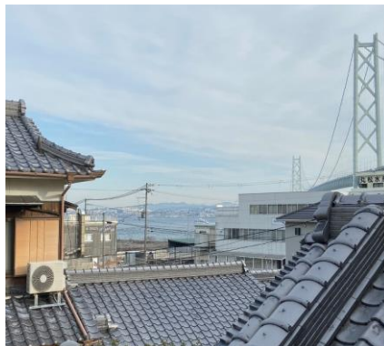
建物外観・2階からの眺望