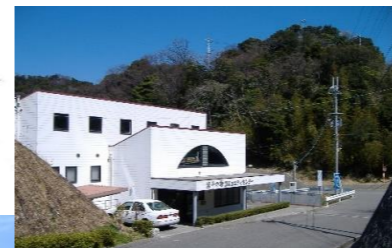
管理事務所 卓球場・シャワー室