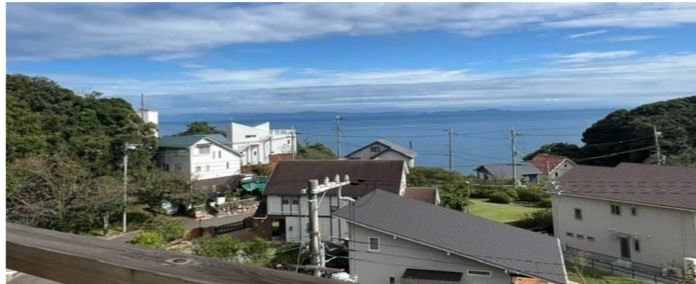
2階バルコニーからの眺望