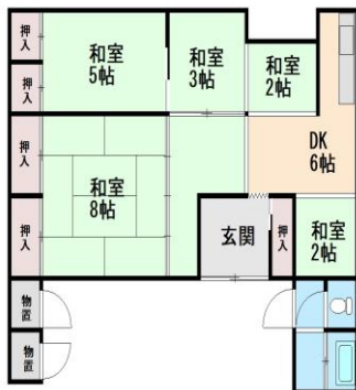
※現況を優先します。