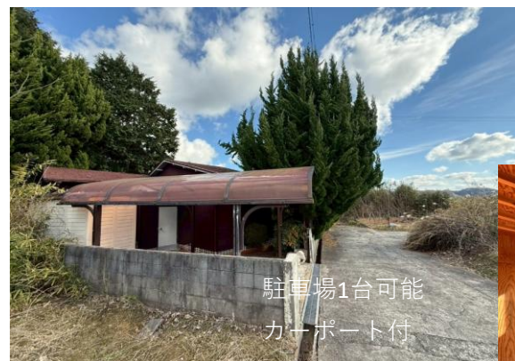
駐車場1台可能 カーポート付